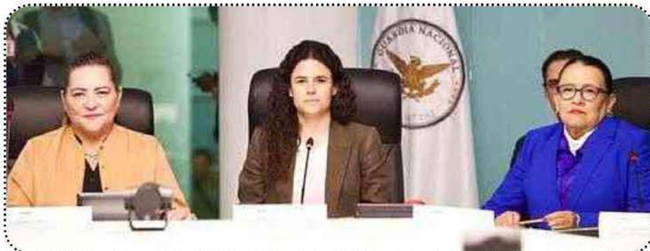
Encuentro, encabezado por las secretarías de Gobernación, Luisa María Alcalde Luján , y de Seguridad y Protección Ciudadana, Rosa Icela Rodríguez Velázquez , así como por la consejera presidenta del instituto electoral, Guadalupe Taddei Zavala

Al profundizar sobre los lineamientos a seguir para garantizar la seguridad y la integridad física de los candidatos y de los votantes Alcalde Luján afirmó que, entre los acuerdos de este grupo de trabajo, destaca el establecimiento de canales eficaces de comunicación para garantizar un proceso electoral