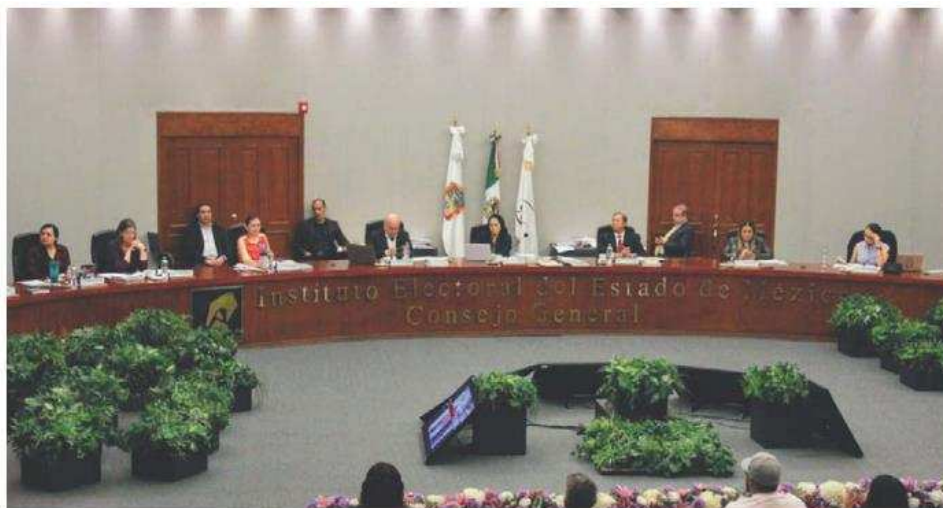
Coincidieron en que de nada valió el exhorto a la paz que emitió el organismo. I. CARMONA