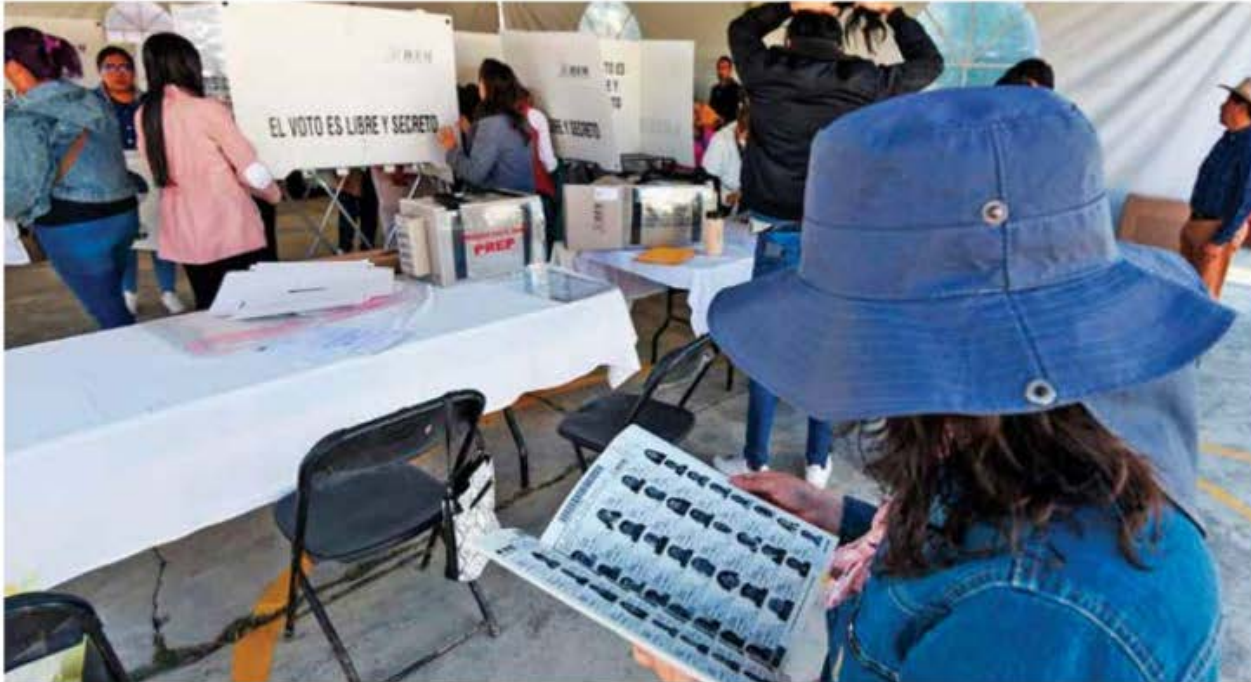
DETALLES | • El órgano electoral precisó el papel que realizarán los observadores.