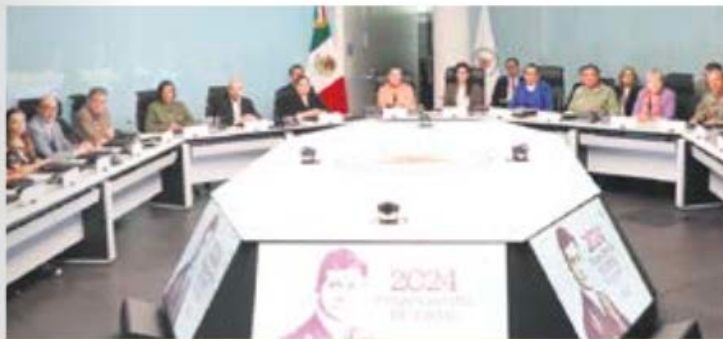
REUNIÓN. Consejeros del INE y el gabinete de seguridad federal, el lunes.

Protección Ciudadana agregó que el gabinete de seguridad informó a los consejeros que habrá 27 mil 245 elementos de las fuerzas de seguridad federal para realizar labores de patrullaje y hacer presencia disuasiva en todas las entidades”, mediante “un operativo bien estructurado”.