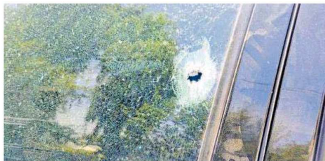
La unidad recibió al menos 10 impactos de bala

cleta dispararon en contra de más de 10 ocasiones el vehículo Beat en que viajaba, aunque tampoco se reportaron personas lesionadas.