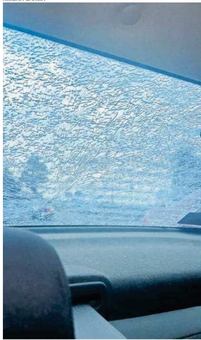
El pasado domingo, la candidata de Ocoyoacac sufrió una agresión con arma de fuego

pasando; no es el primer asunto de ese tipo que acontece en fechas recientes, ya son varios y creo que estamos a tiempo en este proceso electoral de que se tomen acciones más contundentes.