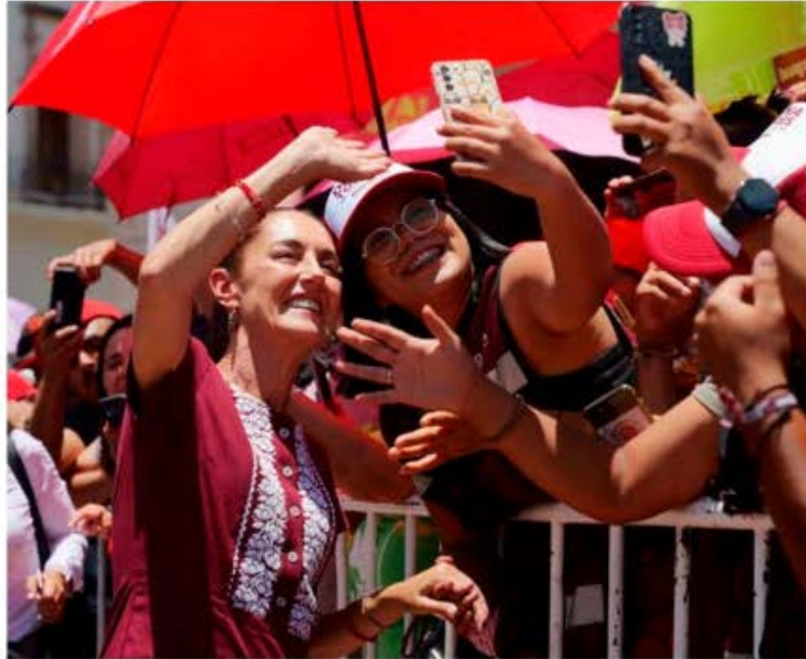
Claudia Sheinbaum, candidata a la Presidencia de la República por la coalición Sigamos Haciendo Historia, en Durango.