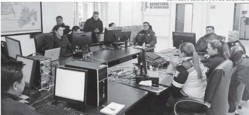
La SSEM monitoreará desde los Centros de Mando