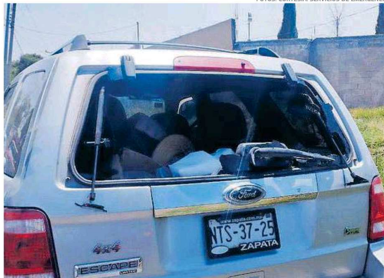
La víctima viajaba a bordo de una camioneta Ford Escape, la cual quedó sin parabrisas trasero

En ese evento, la abanderada señaló que dos sujetos a bordo de una motoci-