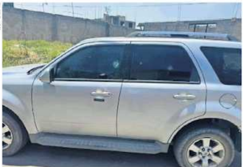
Dos personas en motocicleta interceptaron la camioneta en que viajaba la abanderada del PRI.